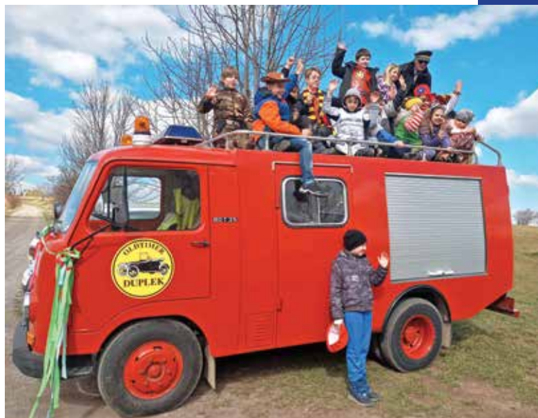
Z Oldtimerji na pustovanje na Ptuj