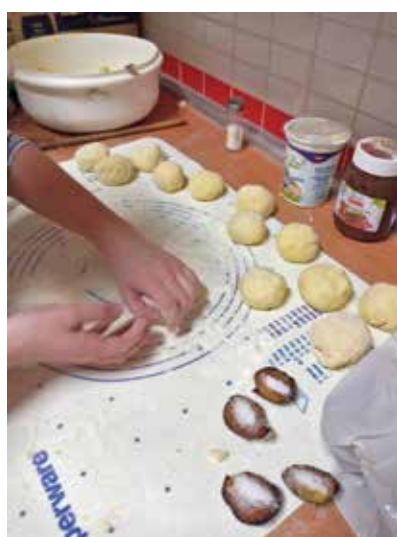
Kuharska delavnica slivovih cmokov