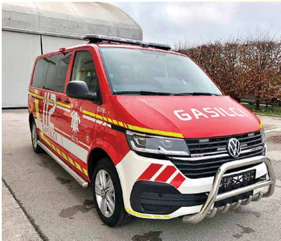
Slika je simbolična, naš avto bo zelo podoben.