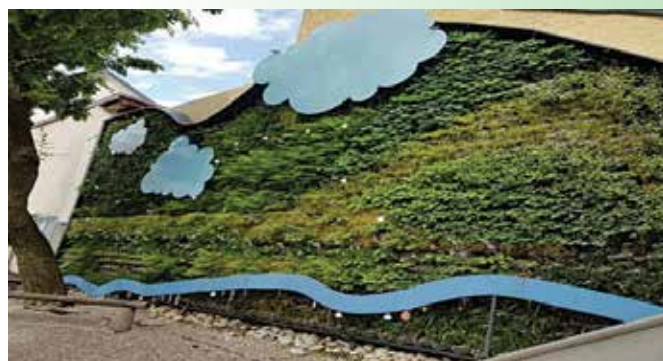
Zelena stena, Družinski center (Ljubljana)