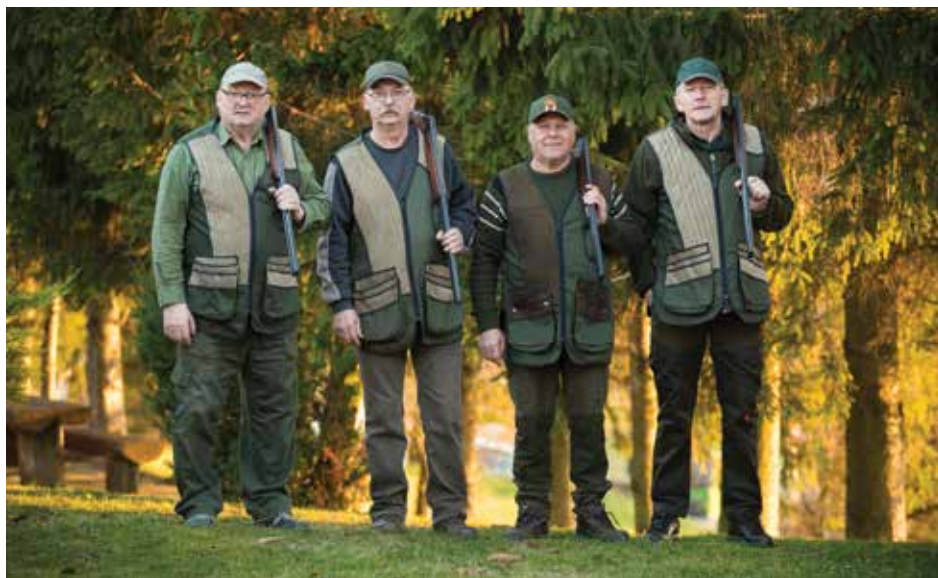
Strelci LD Duplek, pripravljeni na tekmo