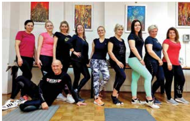
Punce po treningu, vedno dobre volje, pozitivne in nasmejane