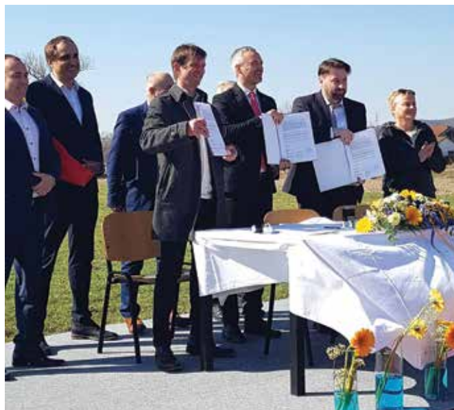
Podpis sporazuma na lokaciji načrtovane gradnje v centru Spodnjega Dupleka

V pritličje objekta se bo vstopalo v sredini objekta pod nadstreškom. Recepcija s sprejemno avlo se bo odpirala proti manjši domski kavarni, ki bo povezana z zelenim atrijem na jugu in bo služila druženju tako stanovalcev kot gostov. V pritličju bo zagotovljen prostor za zaposlene, sestanke s skrbniki stanovalcev ter sprejem gostov. Zdravniška oskrba se bo nahajala v neposredni bližini