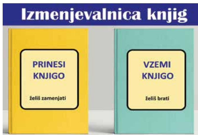
Sistem delovanja izmenjevalnic knjig