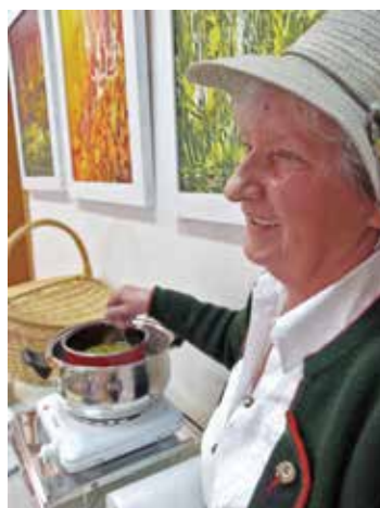
Izdelovanje kamilične kreme