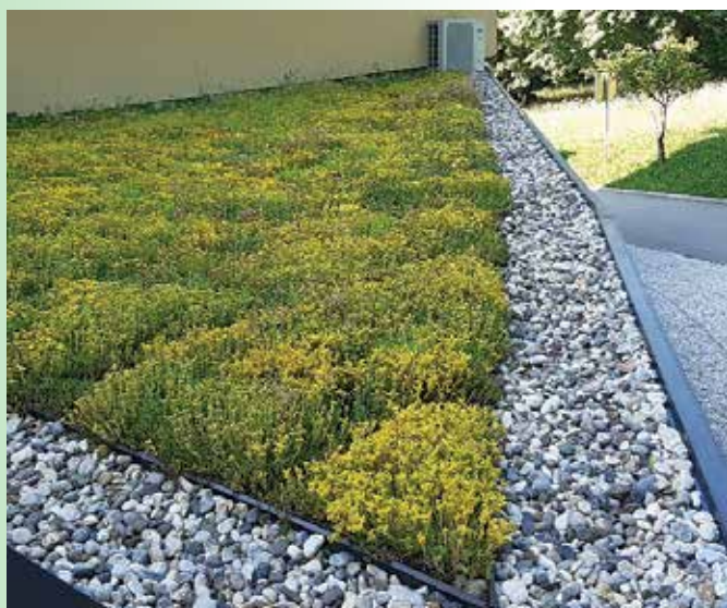
Zelena streha na Čebelarski zvezi Slovenije

Zelena streha predstavlja zaključni sloj strešne kritine, prekrit z vegetacijo, in je primeren odgovor na sodobne ekološke, socialne in ekonomske izzive. Ustrezno strokovno načrtovanje in izvedba zelene strehe izboljšujeta mikroklimatske razmere in kakovost bivalnega okolja ter nudita življenjski prostor rastlinam in živalim. Ljudje so