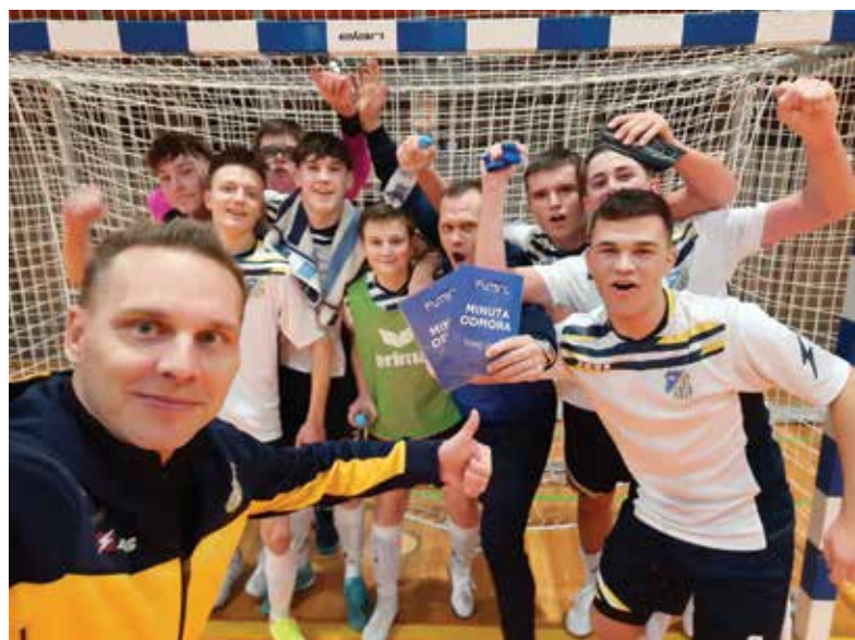
Zmaga selekcije U17 na tekmi 1. futsal lige v Kopru

Ker sta za vsak začetek potrebni dobra forma in pripravljenost, so se selekcije U11, U13 in U17 odpravile na športne priprave, od 17. 3. do vključno 20. 3. 2022 na Debelem rtiču v Ankaranu. Želimo si čim boljše začeti spomladanski del ligaškega tekmovanja, na katerega upravičeno zremo optimistično in ga vsi že komaj čakamo.