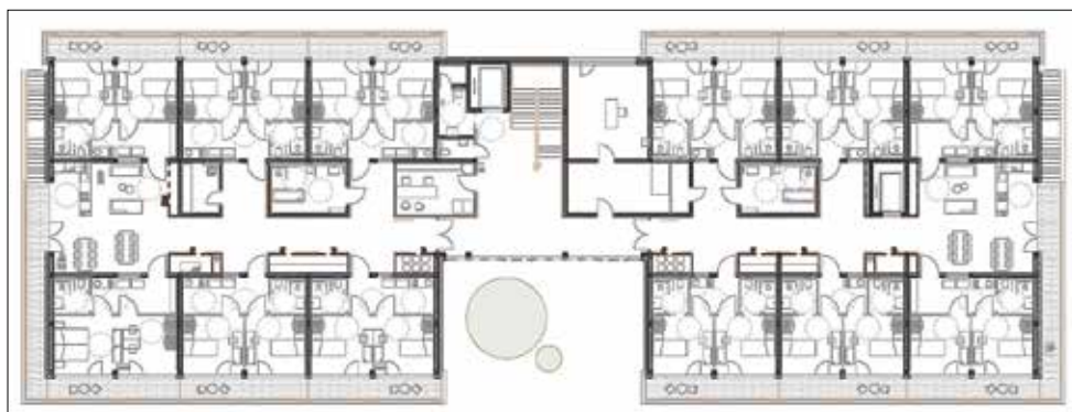
Tloris 2. nadstropja

Vse povzeto po Proplus inženiring, projektiranje d. o. o.