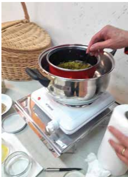
Priprava kamilične kremice

Imeli so kuharsko delavnico, pravljичne urice, družabne igre, pustni torek na Ptujju z društvom Oldtajmer iz Dupleka, tačke pomagačke na obisku in druženje s kužki, kvačkanje, izdelavo voščilnic za mamice ob 8. marcu in izdelavo rožic iz krep papirja.