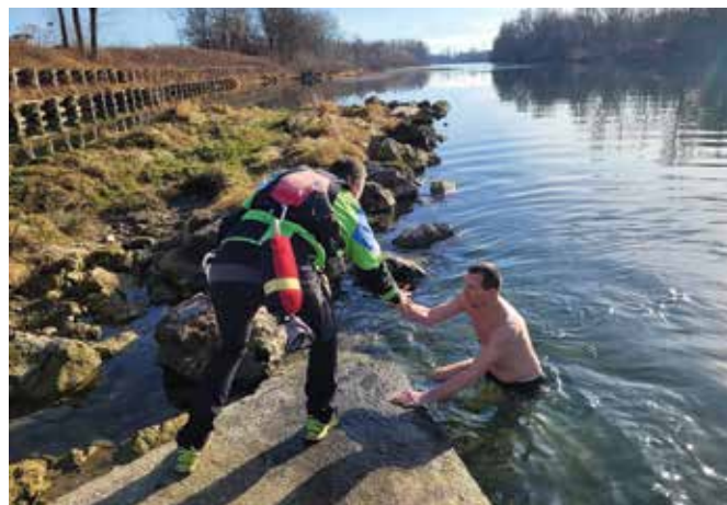
Varnost je na prvem mestu in ta dogodek ni bil izjema

Ker mora biti varnost pri takšnih podvigih vedno na prvem mestu, je udeležence plavanja na pomolu spremljala oseba, usposobljena za reševanje iz divjih voda. Na obali je plavanje spremljalo nekaj deset mimoidočih sprehajalcev. Najmlajši plavec je bil star 20 let, najstarejši pa je štel 64 let. Vsem plavalcem smo za spomin podarili skodelico z logotipom našega društva, da se bodo ob jutranji kavici spomnili na ta dogodek.