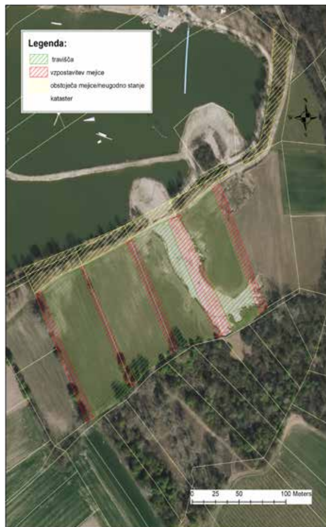
Območje zasaditev ob gramoznici v Zgornjem Dupleku

V okviru sadnje avtohtonih drevesnih (divja češnja, divja jablana, skorš, brek, poljski javor, hrast, beli gaber) in grmovnih (črni trn, glog, rumeni dren, brogovita, dobrovita, leska) vrst je bilo na našem območju posajenih skupno 3970 sadik, od tega 387 drevesnih in 3583 grmovnih. V okviru setev travne mešanice z dodatkom žit pa bosta ponovno vzpostavljena dva hektarja ekstenzivnih travnišč.