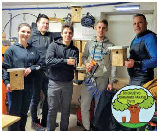
Gnezdilnice smo več dni izdelovali člani in podporniki društva