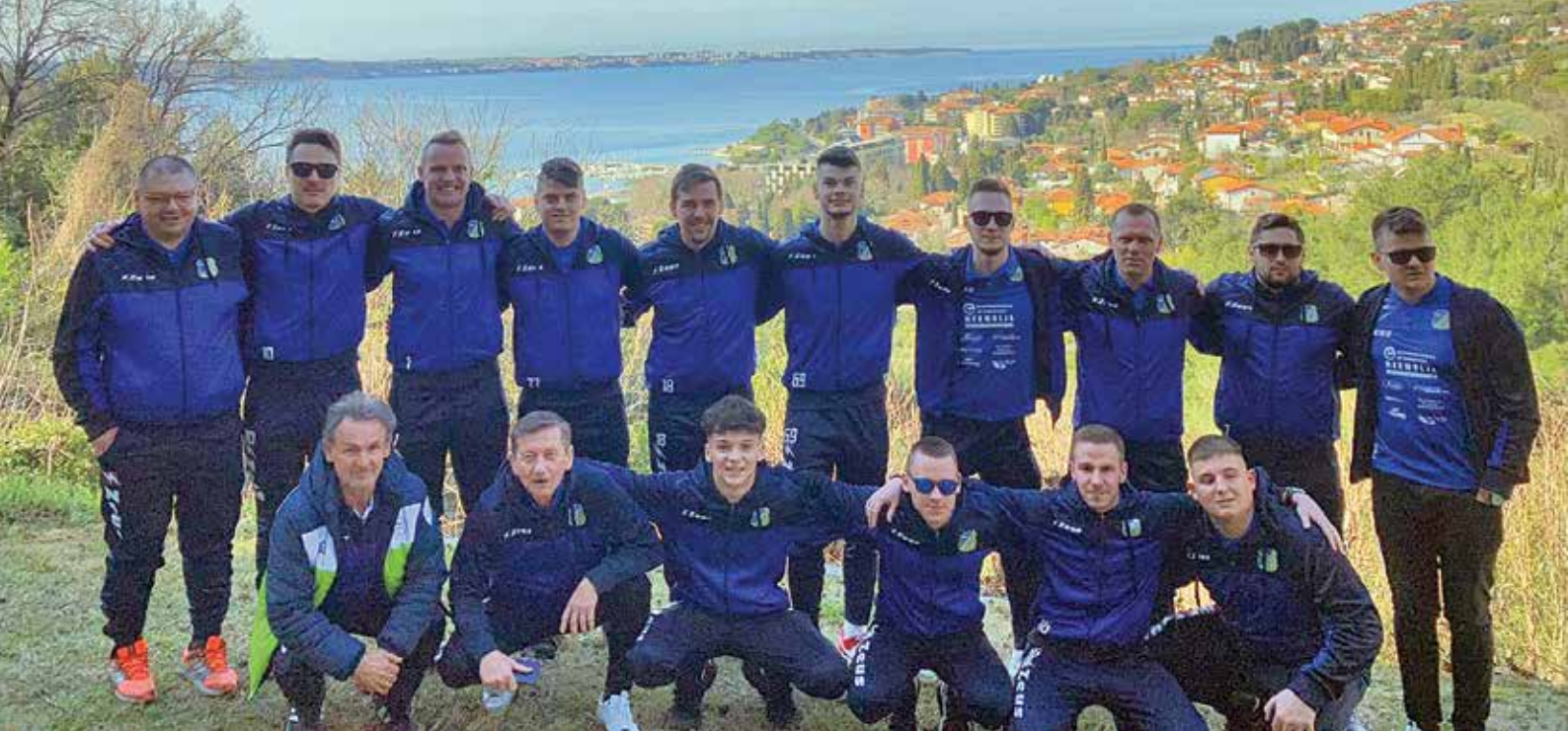
Članska ekipa na pripravah