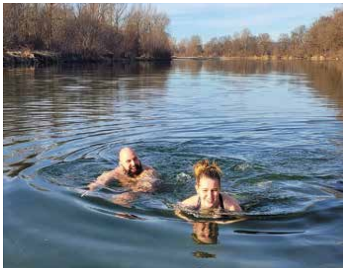
Na sončen prvi januar 2022, je v Dravi zaplavalo 14 fantov in 4 dekleta.

To pomeni, da plavalcev nismo vabili. Lahko pa se je plavec odločil za samoiniciativno plavanje na tem mestu. Ker je obala reke Drave seveda javno dobro, ima do tega vsak pravico.