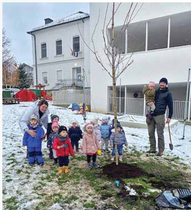
Uspelo nam je