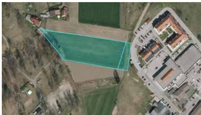
Območje predvidene gradnje

Na severni strani objekta je predvidena dostopna cesta z večjim vzdolžnim parkiriščem in pločnikom, zato so na tej strani vsi glavni vhodi v objekt. Tloris pritličja zavzema obliko pravokotnika s stranicama 70 x 20 m. Predviden je objekt etažnosti P+2, vendar zasnova dopušča naknadno povišanje objekta za eno nadstropje v primeru potrebe po večji kapaciteti doma.