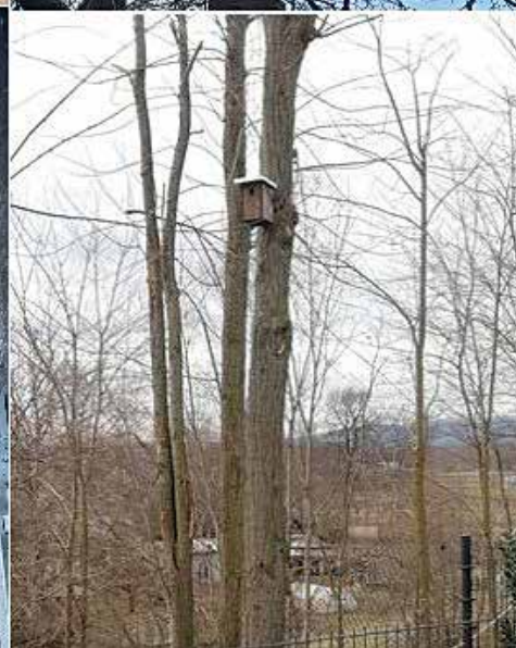
Nekaj primerov gnezdilnic, ki so jih otroci s starši namestili v naših naseljih