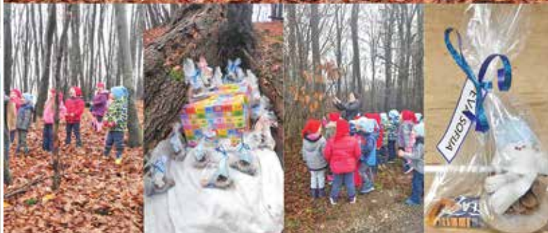
Naši najmlajši (Bibe in Pikapolonice) pri iskanju skritega zaklada