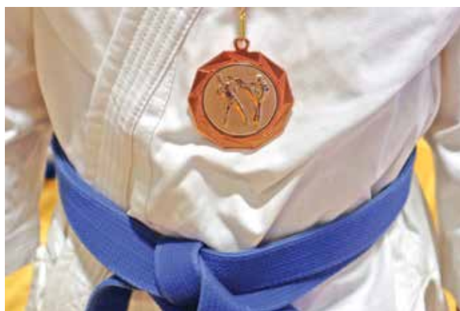
Medalja z državnega prvenstva