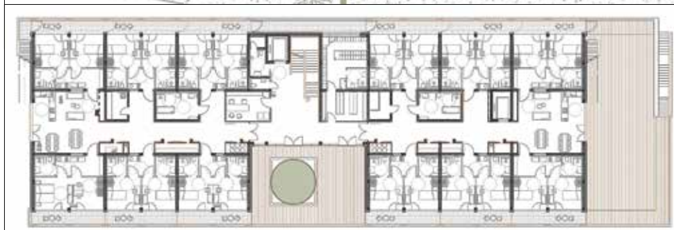
Tloris 1. nadstropja