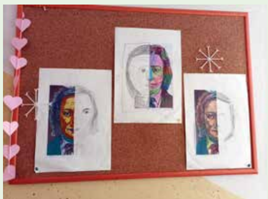
Risanje – Franceta Prešerena