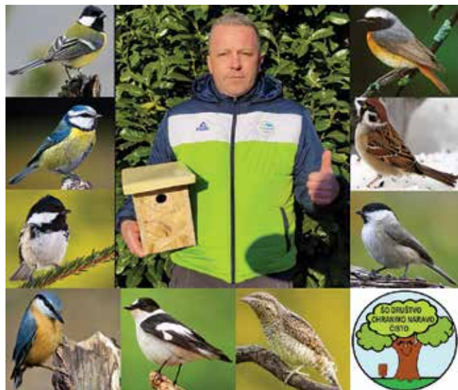
Primer izdelane gnezdilnice in vrste ptic, ki jo bodo potencialno zasedale

Material je društvo financiralo z donacijami, ki smo jih prejeli od občank in občanov za koledarje društva 2022. Na tem mestu se vsem, ki ste prispevali za dober namen, še enkrat iskreno zahvaljujemo.