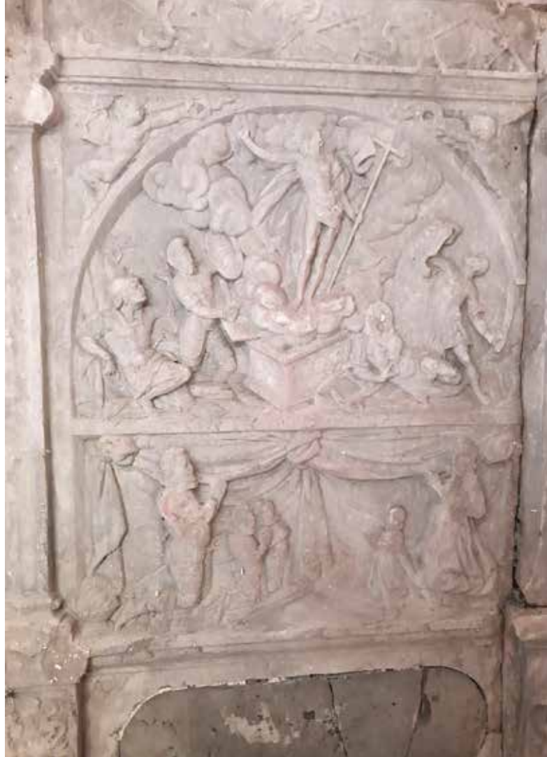
Relief z vstajenjem iz leta 1597

Na veri v Jezusovo vstajenje temelji vse krščanstvo. V njem je temelj upanja, ki daje trdnost in moč obstoja v najtežjih preizkušnjah življenja. Daje zagotovilo, da je življenje močnejše od smrti. Da nobeno zlo nima zadnje zmage, pa naj se še tako zdi, da triumfira in zmaguje. Ve-likonočno upaje je garant smisla celotnega stvarstva in človeka ter zgodovine. Kljub nekaterim nesmisлом v živ-ljenju človeka in človeštva sta celota in njen izhod znan-movana s smislom. Jamstvo mu daje moč Božje ljubezni, ki iz smrti obuja življenje, iz praznine polnost, iz nesmisla smisel, iz časa večnost.