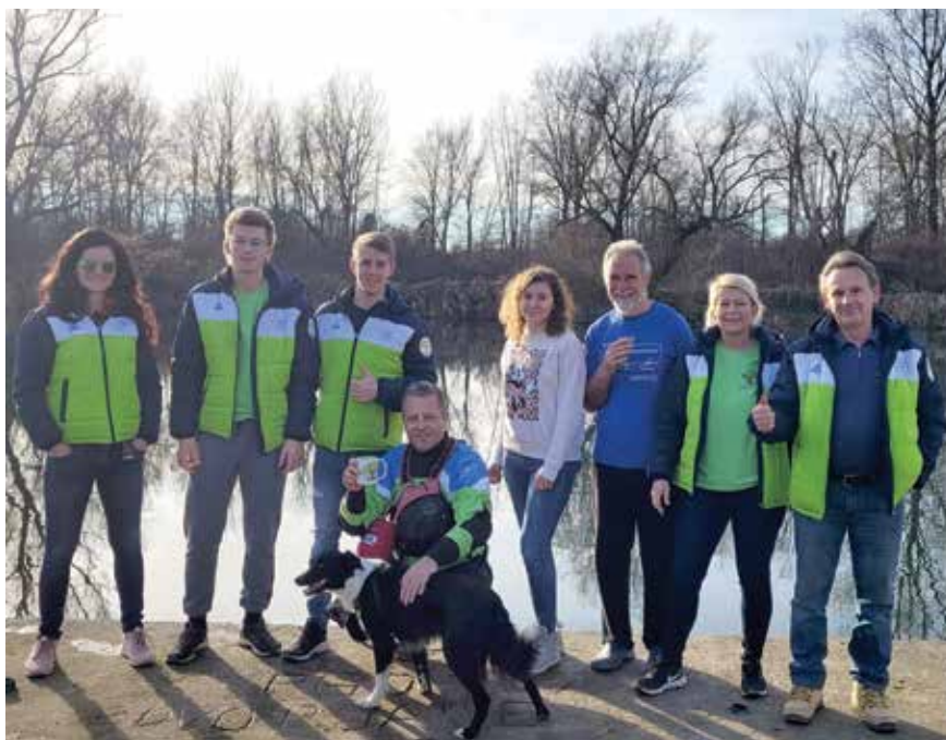
Ekipo društva je poskrbela, da je vse potekalo po načrtu

plavalcev in še več gledalcev ter bi tako pomenila veliko promocijo občine Duplek. Glede na lepo vreme bi se na obali zbralo nekaj 100 ljudi, ki bi se lahko podružili ob dobri kapljici naših domačih vinogradnikov in tudi zaplesali ob živi glasbi.