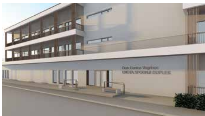
Pogled na severno fasado