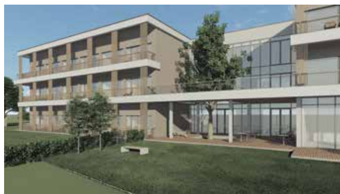
Pogled na južno fasado