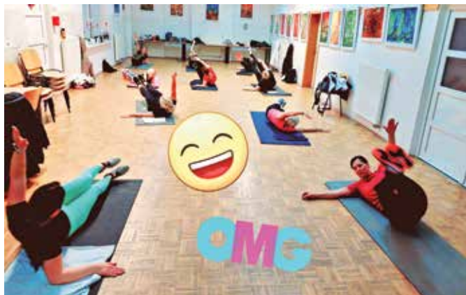
Nikoli ni pretežko, punce zmorejo