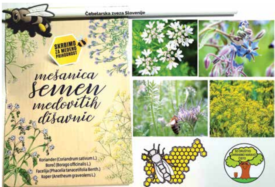
Privabilni posevek za opraševalce