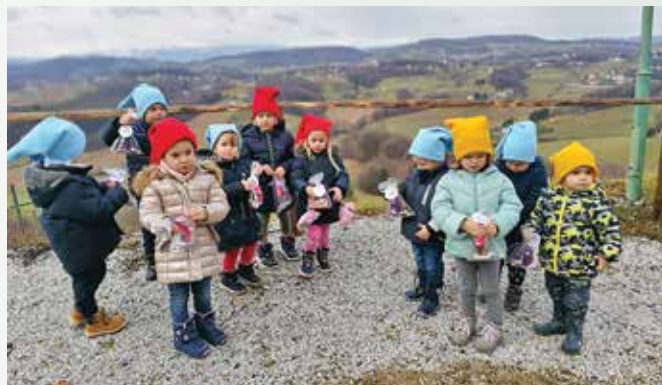
Sončki so uspešno opravili naloge in našli skrita darila.

Zaradi kovidnih razmer smo morali Palčkovanje z gradu Vurberk prestaviti v okolico vrtca. Cel mesec so bile dejavnosti povezane s temo palčkov (branje zgodb o palčkih, ustvarjanje palčkov, učenje pesmic in deklamacij o palčkih). Tudi mi smo za en dan želeli postati palčki, zato smo si naredili palčkove kape, prebrali palčkovo pismo in se navdušeni odpravili na lov za skritim zakladom. Na poti so nas čakale različne naloge (ples, petje, deklamacija) in namigi, s pomočjo katerih smo prispeli do skritega zaklada in presenečenja, ki so ga otroci nestrpnost pričakovali. Razveselili smo se škatle presenečenja, v kateri je bil paket za vsakega otroka (ročno izdelan palček za spomin in sadna ploščica). Otroci so bili ob vrtnitvi v vr-