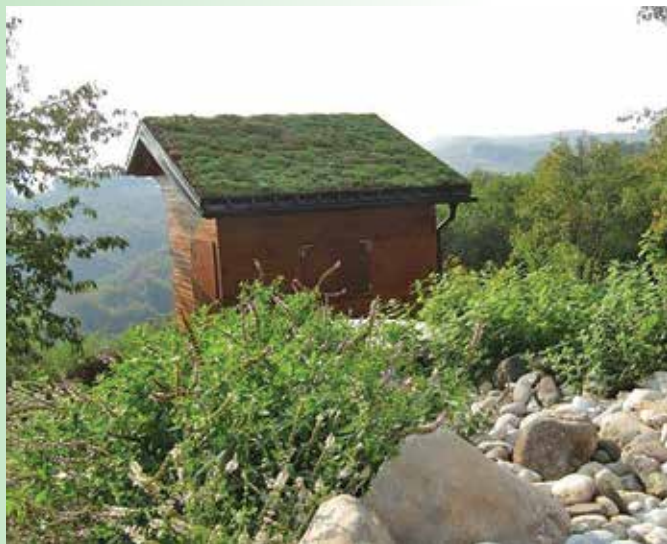
Slovenski čebelnjak z zeleno streho