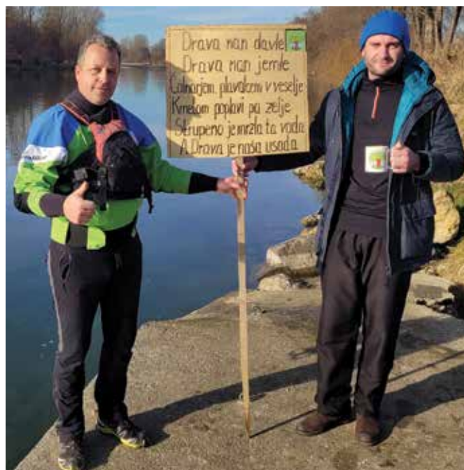
Glavna nit dogodka je ozaveščanje o pomenu Drave za lokalno okolje

Društvo Ohranimo naravo čisto izvaja prireditev Novoletni skok v Dravo predvsem z okoljevarstvenim namenom, s katerim želimo ozavestiti prebivalce o prednostih reke Drave za naše okolje. Da ljudje ne bi gledali na