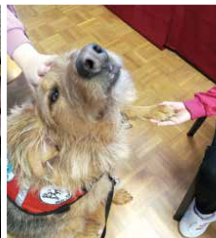
Kodi na obisku – društvo Canis