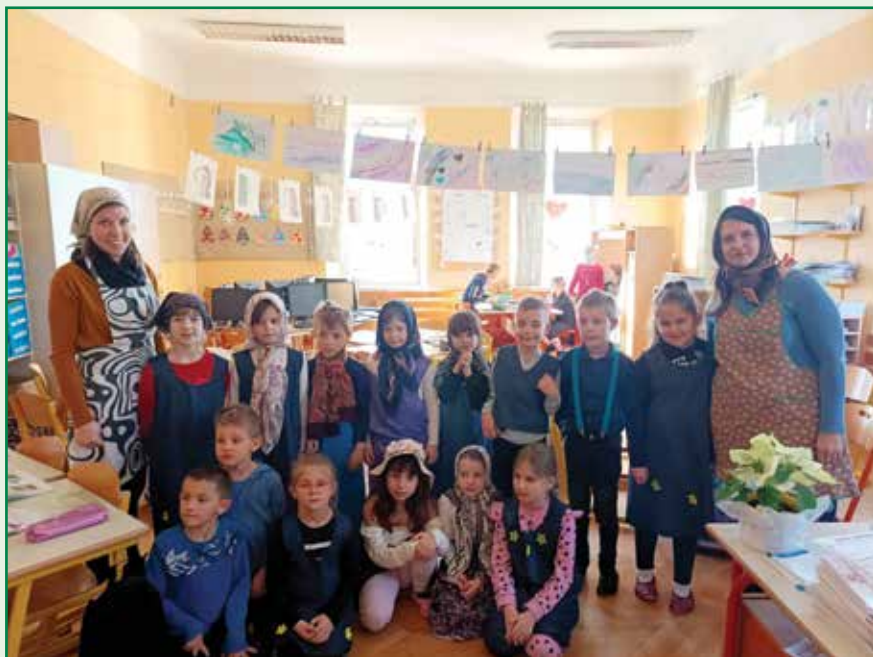
1. b malo drugače

Tudi ustvarjali smo – portret Franceta Prešerna smo narisali v »preteklosti in prihodnosti«. Tako so nastale čudovite risbe, ki so na eni polovici črno-bele in na drugi mavrične. Za popoln konec