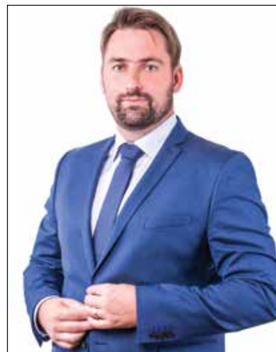
Mitja HORVAT, župan

Optimizem in upanje še vedno ohranjam, saj je to pot, ki ohranja veselje do življenja in dela. Veliko upanja in veselja želim vsem vam. Želim vam veselo veliko noč in lepo praznovanje.