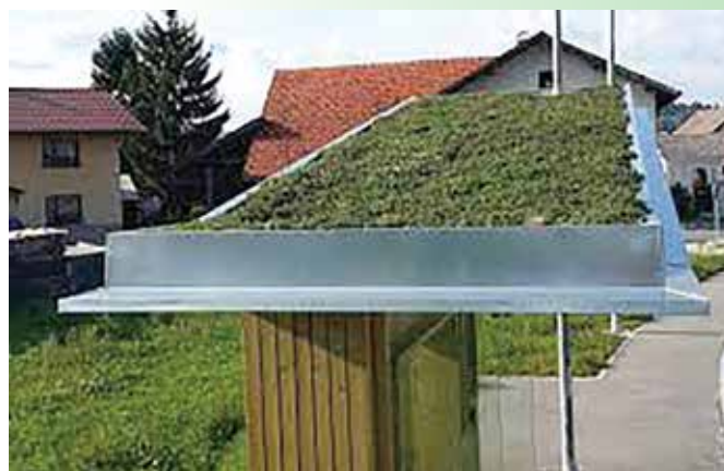
Zelena streha avtobusne postaje (Logatec)

V projekt ČZS Dan vseslovenskega sajenja medovitih rastlin so vključena že številna podjetja, organizacije, lokalne skupnosti in posamezniki, tudi iz tujine. Ob tem va-