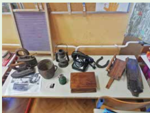
Razstava starih predmetov