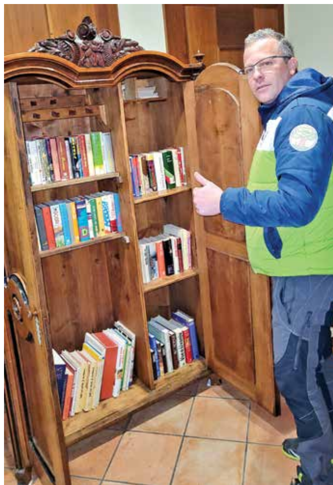
Izmenjevalnica knjig v Zgornjem Dupleku

Vse knjige je društvo pridobilo brezplačno in jih daje do nadaljnjega v prosto uporabo tako občankam in občanom kot tudi obiskovalcem naše občine. Starinska omara je v lasti društva. Naša želja je, da ob pogoju pridobitve primernih lokacij podobno izmenjevalnico