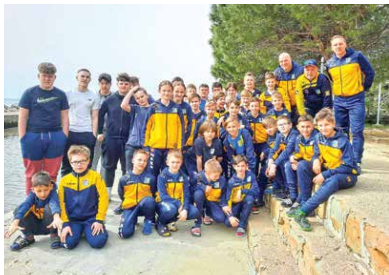
Priprave selekcij U11, U13 in U17