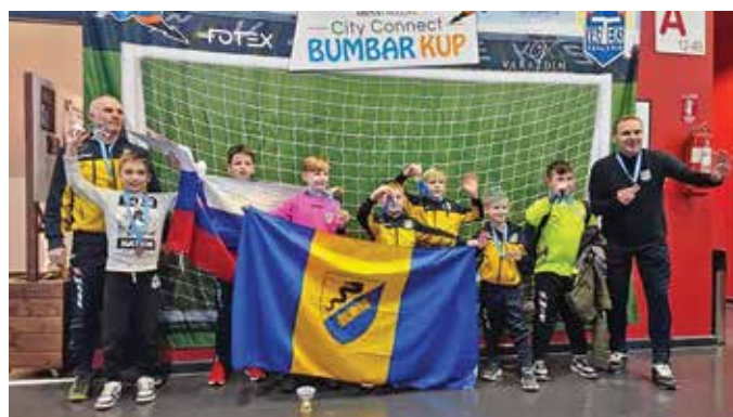
Selekciji U9 in U12 sta se udeležili mednarodnega turnirja v Varaždinu na Hrvaškem

Seveda smo pridobili tudi renome nogometne šole. V jesenskem ligaškem delu so uspešno tekmovalе ekipe v selekcijah U7, U9, U11, U13 in U17, pri čemer lahko na kratko v nogometnem žargonu zapišemo, da je bilo več zmag kot porazov.